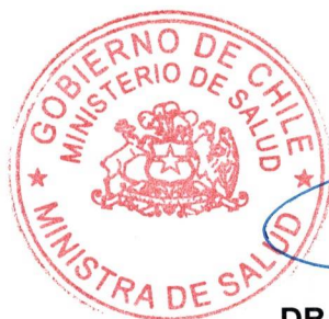
DRA. XIMENA AGUILERA SANHUEZA MINISTRA DE SALUD