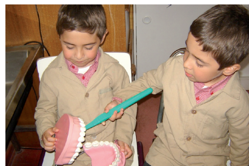
Nivel transición escolar - Junaeb

Desde el jardín infantil y los niveles de transición en las escuelas, es posible abordar esta misión desde la más temprana edad, para que los conocimientos adquiridos por las familias, educadores, comunidad y equipos de salud se transformen en acción y juntos logremos que nuestros niños y niñas adquieran los hábitos para el cuidado de su salud bucal.