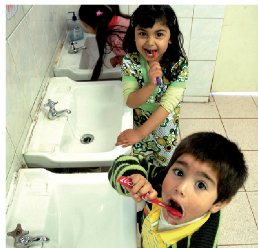
Jardín Infantil Integra