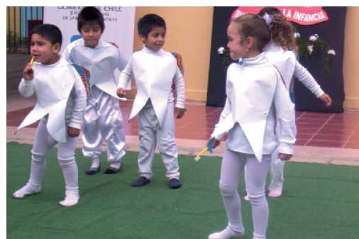
Jardín Infantil Colorín Colorado. Junji - IV región

Este programa está presente en 70 comunas de 14 regiones del país, con la participación de más de 4.000 funcionarios de casi 600 jardines de Junji e Integra, beneficiando a 30.000 niños y niñas en edad preescolar.