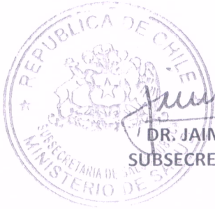
Jaime Burrows Oyarzún DR. JAIME BURROWS OYARZÚN SUBSECRETARIO DE SALUD PÚBLICA

El hecho de que él o la adolescente acudan al centro de salud en busca de atención profesional para resolver alguna inquietud sobre su estado de salud, denota la suficiencia de sus capacidades evolutivas o madurez, para ejercer sus derechos en este ámbito. La negativa de atención, no sólo puede vulnerar el derecho de acceso a la salud de los y las adolescentes; sino que también contraviene el deber ético de los profesionales de salud de brindar la atención que se les solicita. Por su parte, conlleva el riesgo de alejamiento de éstos respecto del sistema de salud, provocando que la afección por la que se pretendía consultar no tenga diagnóstico ni tratamiento alguno, lo que es contrario al interés superior que debe primar en este tipo de decisiones.